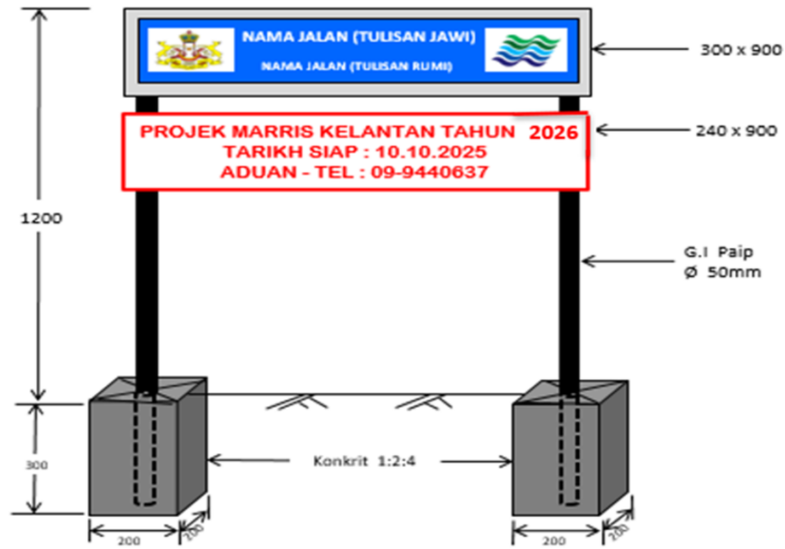
PANDANGAN HADAPAN & BELAKANG